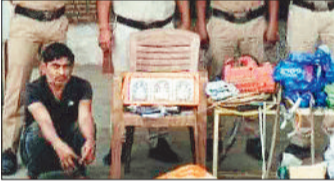
अरोपियों की निशानदेही पर चोरी किए गए मोबाइल बरामद कर लिए गए पुलिस ने दोनों आरोपियों को गिरफ्तार कर सूरजपुर न्यायालय में पेश किया, जहां से उन्हें न्यायिक रिमांड पर जेल भेज दिया गया है। उक्त